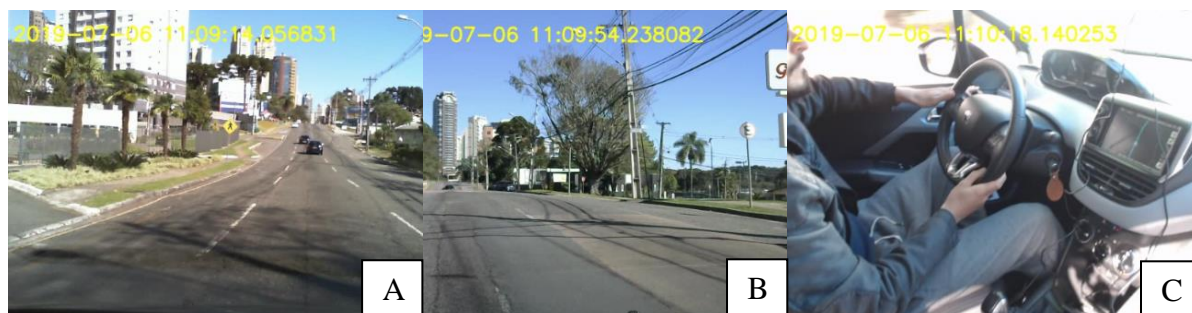
Figura 2: Imagens capturadas durante a fase de testes. (A) Imagem da câmera 1. (B) Imagem da câmera 2. (C) Imagem da câmera 3

Atualmente está em execução uma fase de testes, no qual um veículo está sendo utilizado para identificar possíveis problemas, e fazer ajustes antes do experimento definitivo. A Figura 2 apresenta imagens capturadas das três câmeras instaladas nesse veículo teste.