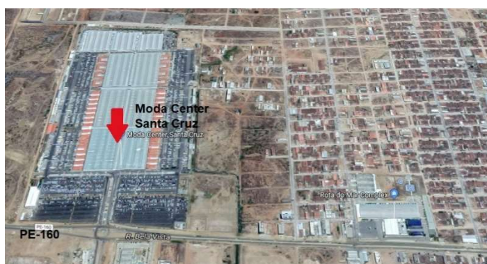
Figura 1: Localização do Moda Center Santa Cruz

Já o Moda Center Santa Cruz, localizado na Rodovia PE-160 (Figura 1), periferia da cidade, reúne mais de 10 mil pontos comerciais, distribuídos em seis módulos que abrigam mais de 9.500 boxes e mais de 800 lojas. Nos períodos de maior movimento, o local chega a receber entre 80 a 150 mil clientes por semana. Já em períodos normais, a média de público é de 22 mil por semana.