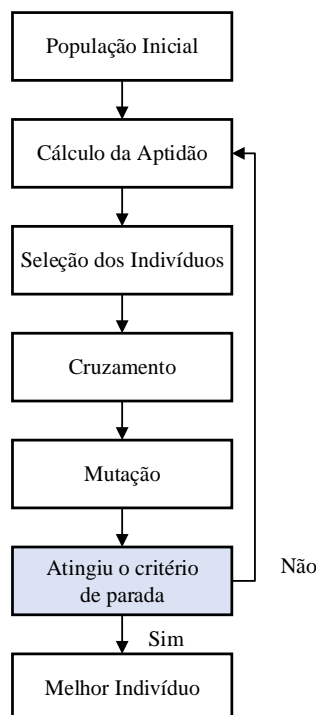
Figura 3: Estrutura de um Algoritmo Gen tico

Neste trabalho cada indiv duo representa uma solu o para o problema, isto  , o sequenciamento do conjunto de caminh es pertencentes a cada talh o. A sele o dos pais acontece pelo m todo de sele o por Torneio, que consiste em escolher dois indiv duos aleatoriamente da popula o e selecionar o melhor ou pior indiv duo de acordo com uma probabilidade k definida anteriormente. Um exemplo do pseudoc digo deste algoritmo (Mitchell 1997)   apresentado na Figura 4.