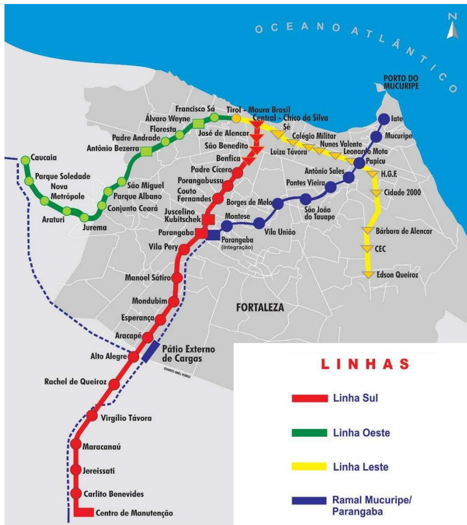
Figura 2: Rede Metroferroviária de Fortaleza.

Em operação comercial desde 2014, a Linha Sul do METROFOR transporta hoje, em média 33.000 pass./dia, que somados aos passageiros da Linha Oeste, do VLT Parangaba-Mucuripe (Ver Mapa 02), recém-implantado e em operação assistida, aos passageiros dos VLTs de Sobral e Cariri, totalizaram 12.640.533 passageiros transportados no ano de 2018. Neste mesmo ano, o faturamento da Companhia Cearense foi de R$ 27.105.156,98 (Vinte e sete milhões, cento e cinco mil, cento e cinquenta e seis reais e noventa e oito centavos), representando um incremento de 33% em relação ao ano de 2017.