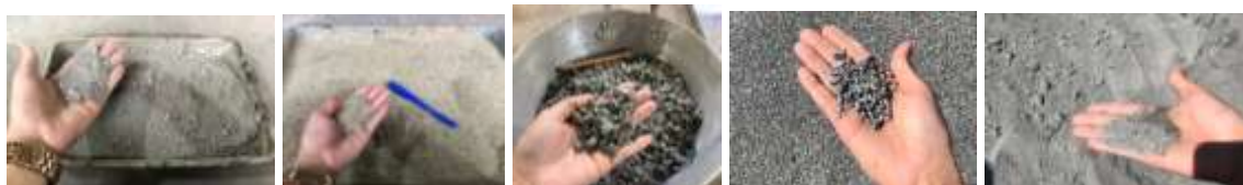
Figura 1: Escória de aciaria LD, Escória granulada de alto forno, Brita 0 fina, Granilha e Pó de brita

O programa experimental foi dividido em duas etapas: a primeira etapa refere-se à caracterização completa dos agregados naturais e siderúrgicos, bem como definir as composições das misturas para enquadramento na faixa II do DNIT. Na segunda etapa serão realizados os ensaios com a misturas do MRAF, inicialmente utilizando agregado natural e posteriormente empregando teores distintos com substituição de agregados naturais por siderúrgicos. Os agregados siderúrgicos são provenientes da empresa Arcelor Mittal Tubarão localizada na cidade Serra no estado do Espírito Santo. Os agregados naturais foram fornecidos pela pedreira Brasitália localizada na cidade Cariacica também do Espírito Santo. Os agregados estão ilustrados na Figura 1.